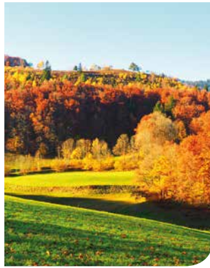
Steuer-Check zum Jahresende 31.12.2018 Tipps, die Sie noch nutzen oder was Sie noch alles erledigen sollten