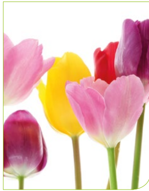
Alles über die Arbeitnehmerveranlagung und die Einkommensteuer 2018